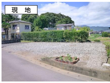
敷地南東側より撮影