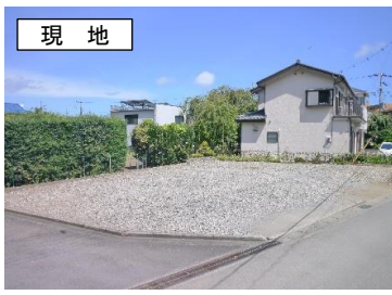
敷地西側より撮影